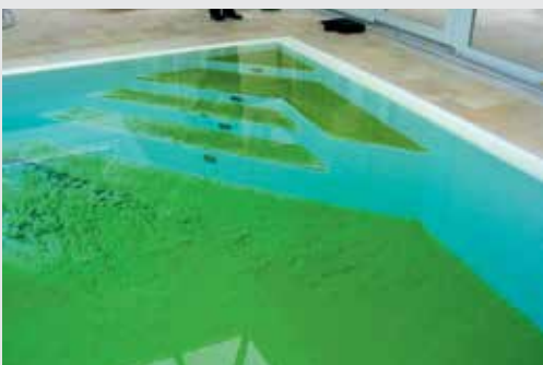
Schwimmbad mit starkem Algenbefall

NoPhos besteht aus dem natürlichen Produkt Lanthan und kann problemlos in öffentlichen und privaten Schwimmbädern sowie in Naturbädern, Teichen und Aquarien eingesetzt werden. Nophos ist ein 3-fach positiv geladenes Ion, welches mit dem 3-fach negativ geladenen Phosphat-Ion \text{PO}_4^{3-} reagiert und einen unlöslichen Niederschlag bildet. Dieser wird anschliessend einfach ausfiltriert.